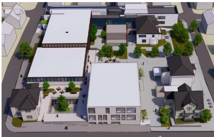
Figur 1 - Illustrasjon av skolen etter ferdig prosjekt sett fra vest mot øst

Rogaland fylkeskommune starter nå opp med den lenge planlagte oppgraderingen av St. Olav videregående skole. Bildet under illustrerer hvordan det gamle menighetsbygget i Wessels gate 35 skal rives og erstattes med nybygg på 3 etasjer som knyttes sammen med resten av skolen og Eiganesveien 24 via et nedsenket koblingsbygg. Gymsalen skal utvides både i høyden og mot Eiganesveien. I tillegg vil uteområder oppgraderes.